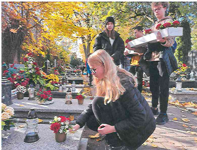
Fot. Harcerze dbający o groby ofiar terroru hitlerowskiego i stalinowskiego

W 2021 roku ze środków gminnych zostały również gruntownie oczyszczone pomniki i pamiątkowe tablice na terenie Wroniek.