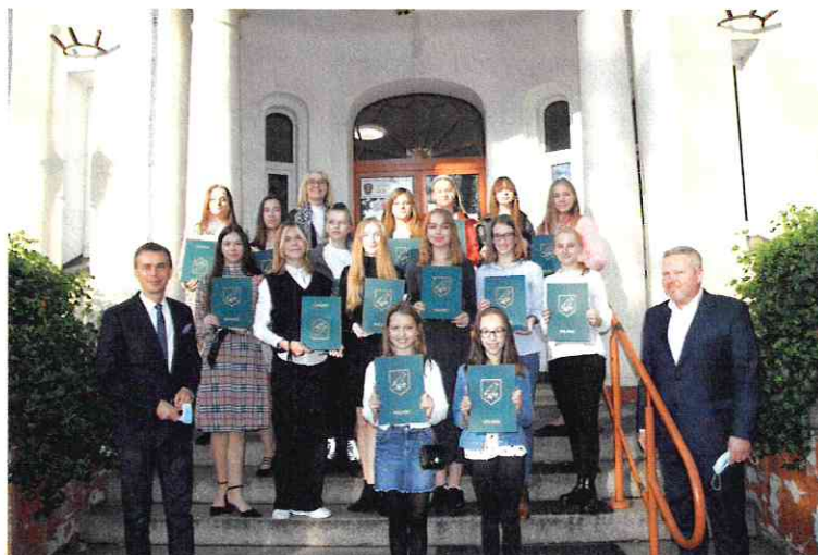
Fot. Wręczenie stypendiów w dziedzinie twórczości artystycznej

w dziedzinie twórczości artystycznej 32 stypendia: 4 stypendiów I stopnia, 20 stypendiów II stopnia i 8 stypendiów III stopnia.