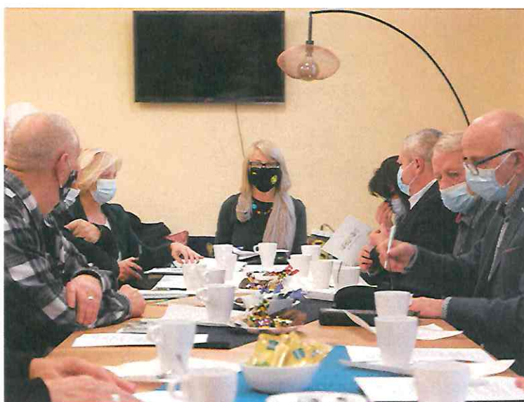
Fot. Posiedzenie Rady Seniorów we Wronkach

Przedstawiciele Rady Seniorów uczestniczą w gminnych obchodach najważniejszych świąt państwowych.