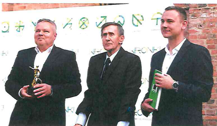
Fot. 100-lecie piłki nożnej we Wronkach

Gmina Wronki była także współorganizatorem takich sportowych imprez jak IV Półmaraton Za Murem i River Triathlon Series Wronki. Burmistrz Miasta i Gminy Wronki patronuje także różnorodnym innym wydarzeniom. W 2021 roku odbyło się 17 wydarzeń sportowych, kulturalnych, społecznych i charytatywnych objętych patronatem. Między innymi były to zawody hobbystyczne, m.in. dla hodowców gołębi pocztowych i wędkarzy, a także imprezy KGW („Ach, damą być” – gminne spotkanie KGW), kulturalne (np. XI Przegląd Zespołów Wokalnych i Kapel Ludowych w Chojnie) oraz o charakterze ekologicznym, jak Sprzątanie Brzegów Warty.