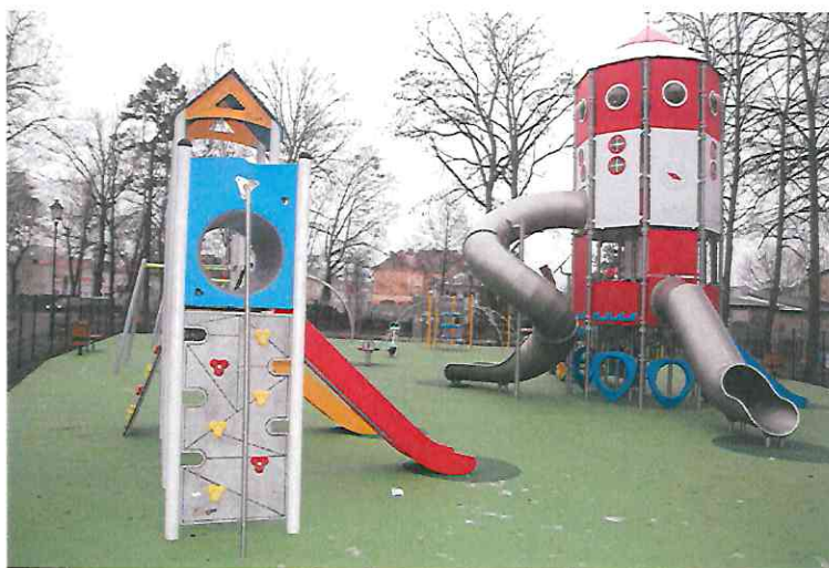
Fot. Plac zabaw na Skwerze Cyryla Sroczyńskiego