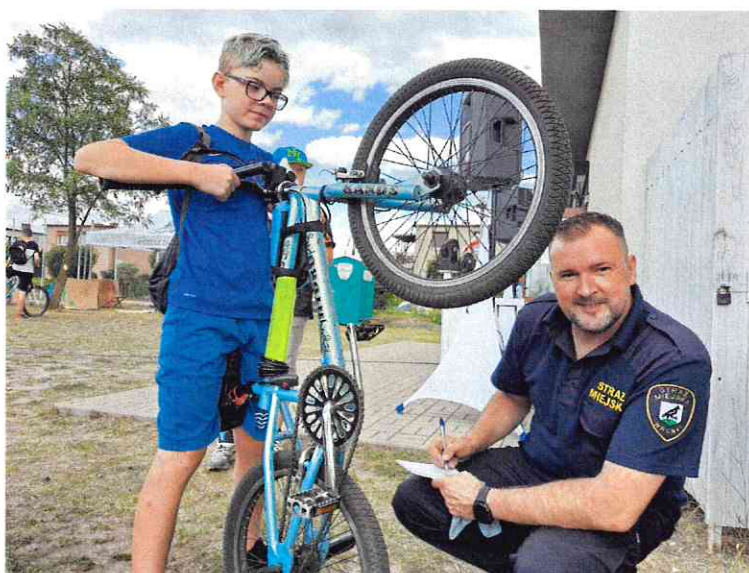
Fot. Strażnicy Miejscy uczestniczący w Festynie Rodzinnym.

W związku z COVID 19 – strażnicy przeprowadzili 396 kontroli przestrzegania obowiązujących przepisów.