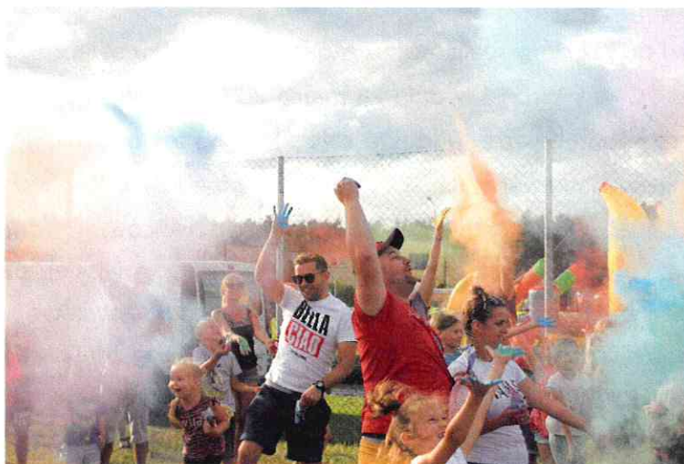
Fot. Festyn Rodzinny na Osiedlu Zamość

Zarząd osiedla Na Górcie przygotował dla mieszkańców dwa festyny: we wrześniu Festyn dla dzieci, młodzieży i rodziców „Witaj szkoło”. Festyn „Spotkanie przy choince” na boisku sportowym przy ulicy Wspólnej.