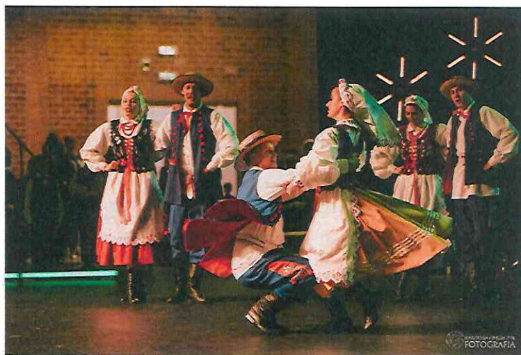
Fot. VII Ogólnopolski Turniej Tańców Polskich o „Wielkopolski Bat” – Wronki 2021