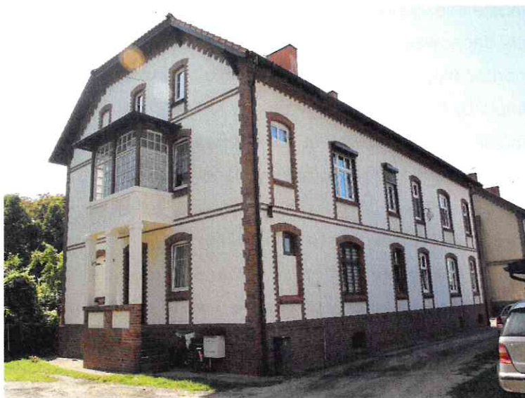
Fot. Kamienica przy ul. Dworcowej po remoncie

„Samorząd dla Dziedzictwa” to konkurs nagradzający gminy za modelowe opracowywanie i wdrażanie gminnego programu opieki nad zabytkami, a głównym celem jest motywowanie samorządów do opracowywania i wdrażania obowiązkowych dla gmin programów opieki nad zabytkami oraz promocję dobrych praktyk w tym zakresie.