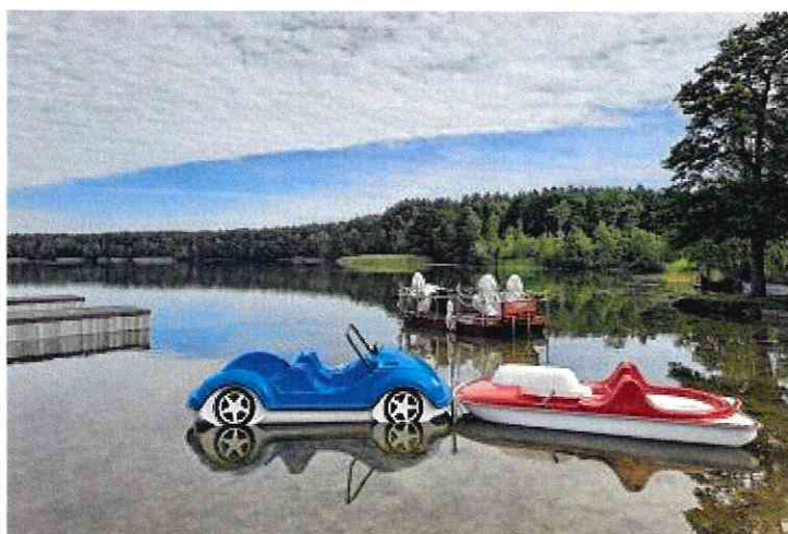
Fot. Nowe rowery wodne na kąpielisku w Chojnie

W 2021 r. mieszkańcy gminy Wronki mogli skorzystać z ciekawej oferty rekreacyjnej nie tylko o charakterze sportowym. Działyły dwa kąpieliska administrowane przez Przedsiębiorstwo Komunalne: w Wartosławiu i w Chojnie. Na kąpielisko w Chojnie zostały zakupione dwa nowe rowery wodne.