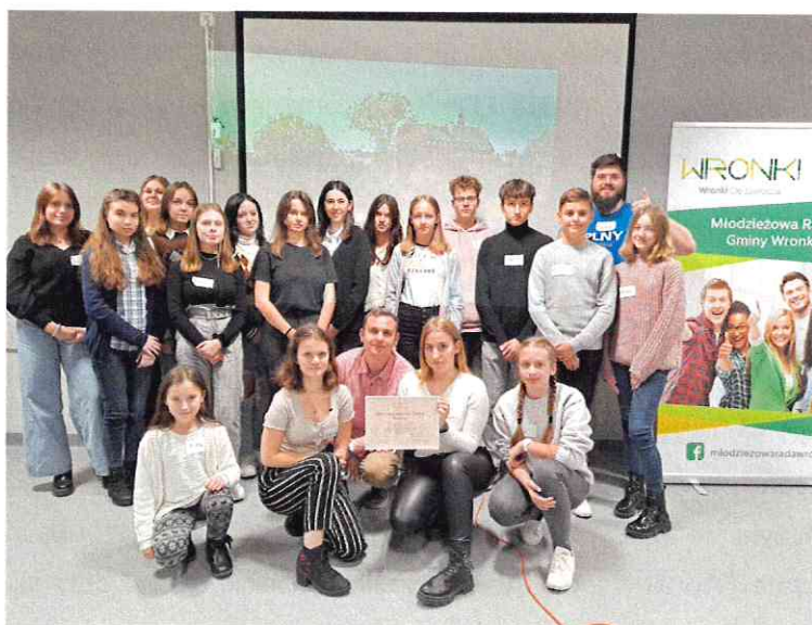
Fot. Warsztaty prowadzone przez Fundację Cavis Polonus

przeznaczone głównie dla młodzieży. Młodzi radni uczestniczyli wraz z przedstawicielami samorządów uczniowskich w warsztatach prowadzonych przez Fundację Cavis Polonus.