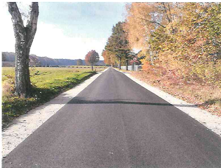
Fot. Droga Lubowo-Karolewo

W 2021 r. wykonano projekty dotyczące następujących inwestycji drogowych: