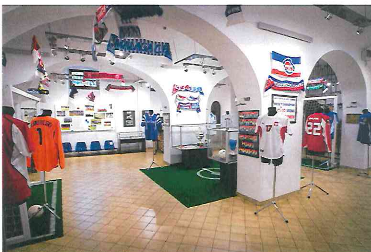
Fot. Wystawa 100-lecie wronieckiej piłki nożnej