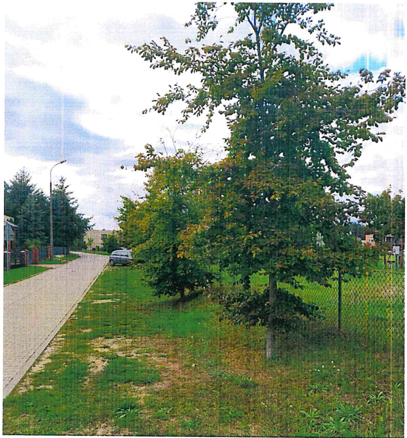
c) ul. Nadbrzeżnej (w kierunku kładki przez rzekę Wartę);